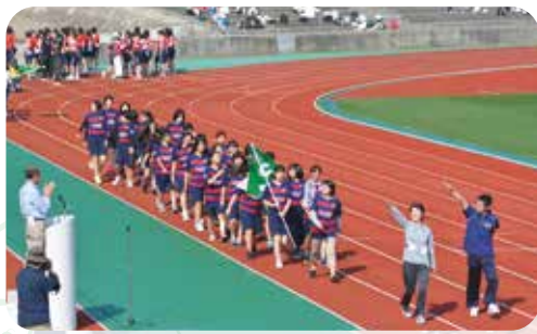
体育大会 (八橋陸上競技場)