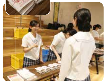
和高祭での販売実習