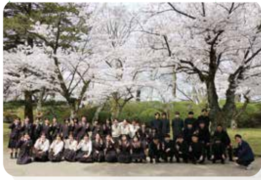
千秋公園でお花見