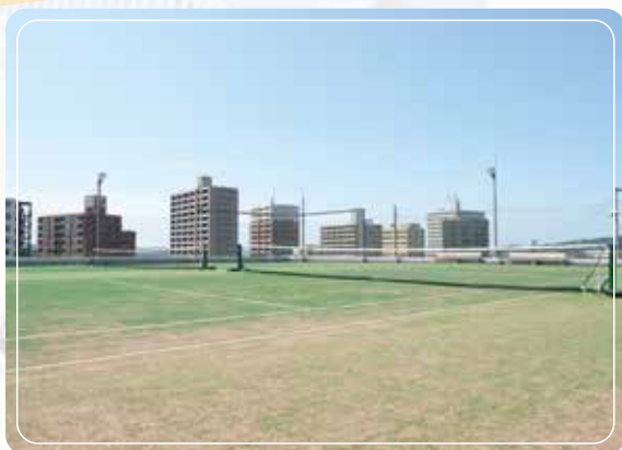
屋上テニスコート