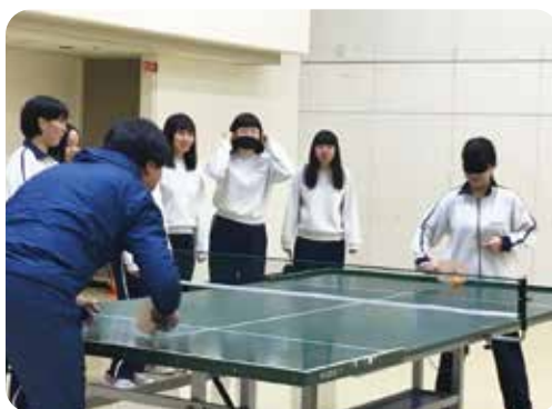
サウンドテーブルテニスの体験