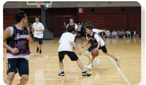
学級対抗 (市立体育館)