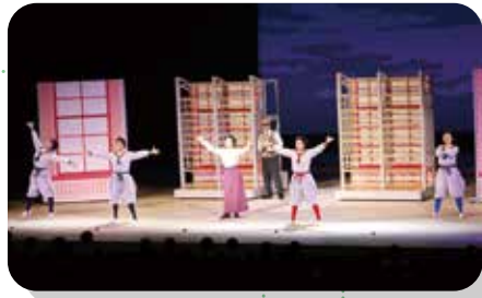
芸術鑑賞(ミルハス)