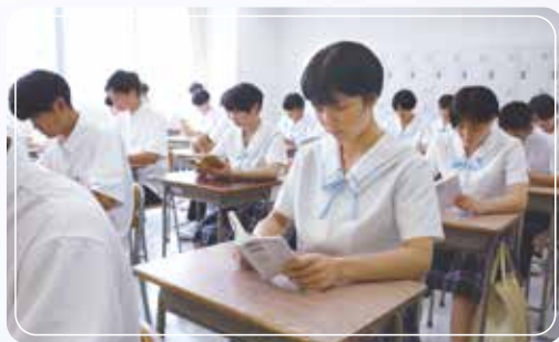
朝読書で一日が始まります