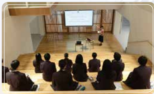
イベントホールでの授業