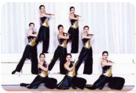
バトントワリング部